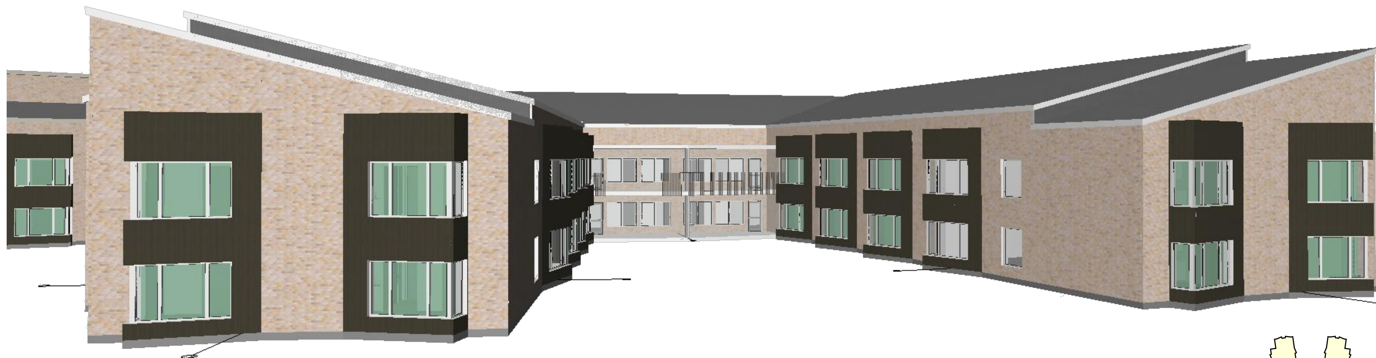
VY FASAD MOT AVDELNINGSGÅRD